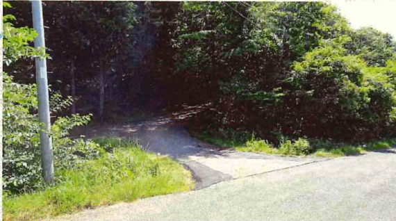
町道石神砂川線から進入(↑参考写真)